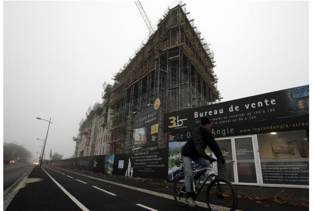
Au Grand Angle, 3B a choisi de mettre l'accent sur le vélo.

Ce qui l'a mis en selle ? Les réunions organisées à la CUS. « Au début, j'allais de notre siège, avenue de la Paix, jusqu'à la CUS en voiture. Un jour, je me suis dit que ce n'était plus possible et j'ai fait l'effort d'acheter un vélo, juste pour ça : me rendre à la CUS. Et là, j'ai redécouvert la ville et des sensations de gamine... Si j'arrivais à mettre chaque acquéreur sur un vélo pour que lui aussi redécouvre